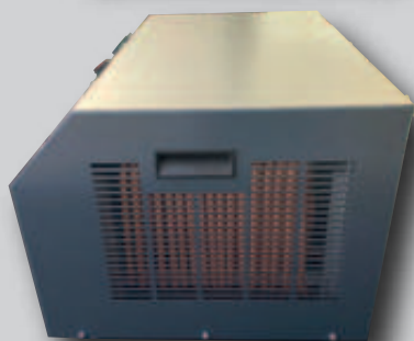
Geräteseitenansicht, Lufteingangsseite mit Griffschale