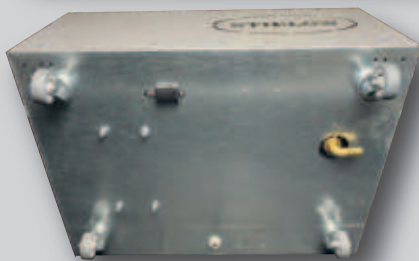
Geräteunterseite mit Schlauchanschluss, Rollen abnehmbar