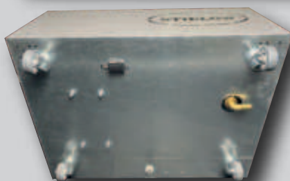
Geräteunterseite mit Schlauchanschluss, Rollen abnehmbar